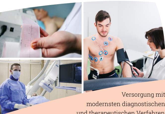
Versorgung mit modernsten diagnostischen und therapeutischen Verfahren.